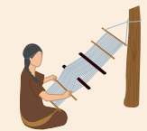
tejido en telar de cintura