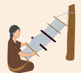
tejido en telar de cintura