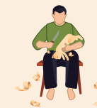
talla de madera

Friends of Oaxacan Folk Art (FOFA) apoya la preservación y promoción de las tradiciones del arte popular de Oaxaca.