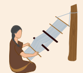
tejido en telar de cintura